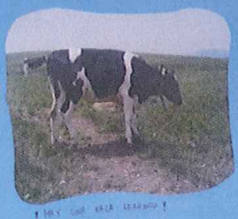
IL BOVINO CHE CREA L'ERBA