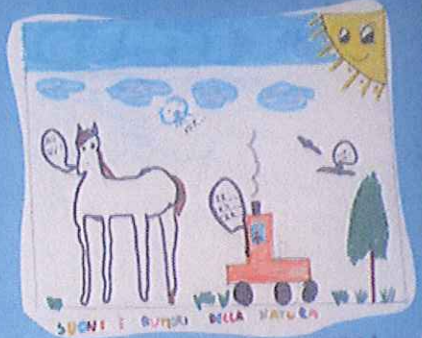
SUONI E OLUCCI DELLA NATURA I SUONI E I SUONI DELLA NATURA